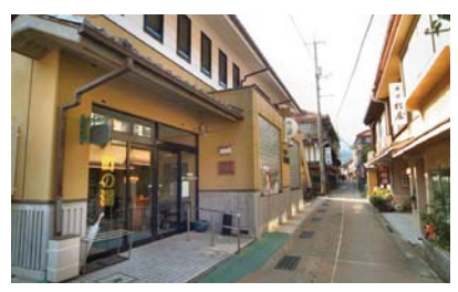
【俵山温泉町の湯玄関と街】