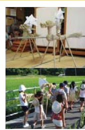
【北浦地方の民俗行事】