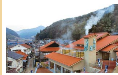
【俵山温泉白猿湯外観】